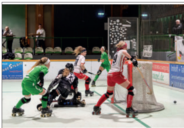
Das Walsumer Tor stand 50 Minuten lang unter Druck

haben die Dörper Cats die Auftaktniederlage zum Start der Bundesliga-Saison ausgemerzt. Das 8:1 gegen die RESG Walsum war zu keinem Zeitpunkt in Gefahr. Für die Duisburgerinnen kam es an diesem Wochenende im Duell mit Cronenberg übrigens knüppeldick: Denn am Vorabend der Bundesliga-Niederlage kassierten sie in eigener Halle gegen die „Mini-Cats“, das Zweitliga-Team von Daniela Hövelmann, bereits eine 3:4-Niederlage.