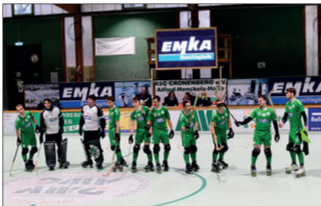
Die Löwen bedankten sich beim Publikum und hatten trotz Erkrankungspech knapp die Nase vorn