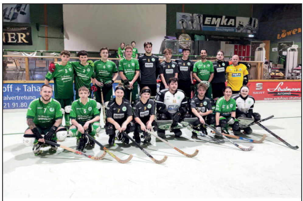
Familientreff beim Spiel in der Regionalliga West RSC II (schwarz) gegen RSC III (grün)