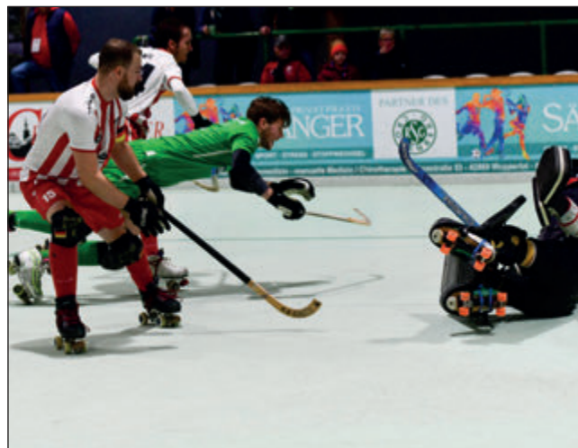
Es ging hart her im Spiel der Traditionsmannschaften. Die Gäste übertrieben die Härte ein wenig und bekamen dafür die Quittung in Form von Blauen Karten