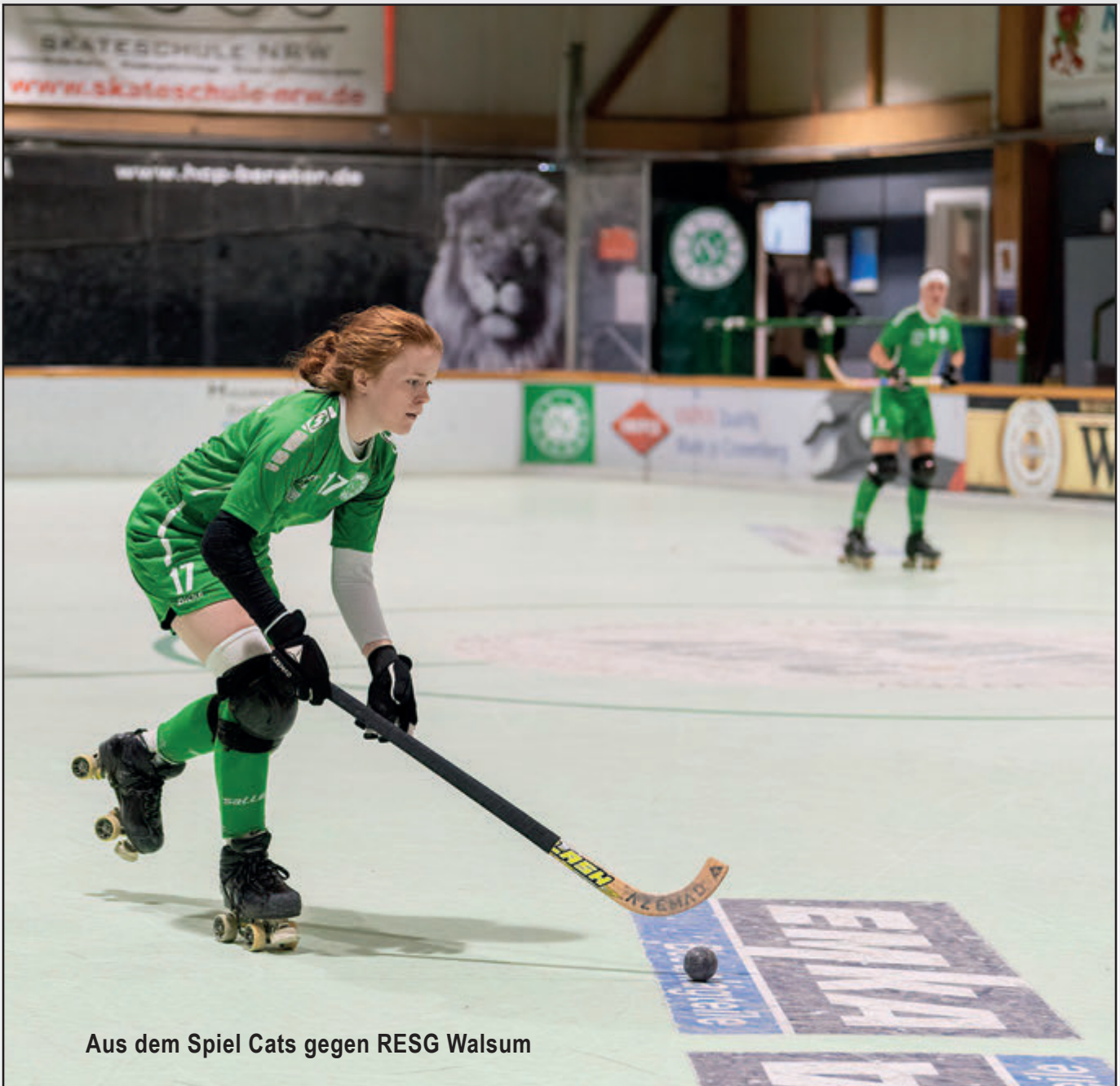
Aus dem Spiel Cats gegen RESG Walsum

Seite 7/8 Löwen Auch diesmal ein Sieg gegen Walsum