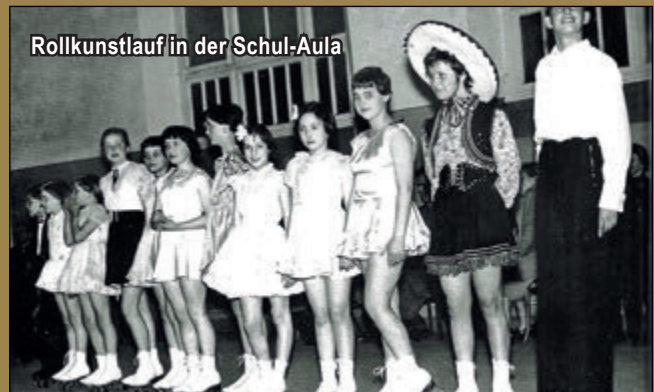
Rollkunstlauf in der Schul-Aula

Nach dem 2. Weltkrieg fanden sich die Rollschuhläufer wieder zusammen und schlossen sich dem Cronenberger SC an. 1954 schließlich trennte man sich vom CSC und gründete mit 154 Rollsportlerinnen und Rollsportlern den Rollschuh-Club Cronenberg. Man spielte auf der schrägen Schulplatzfläche am Lenzhaus oder betrieb Kunstlauf in der Aula der Schule.