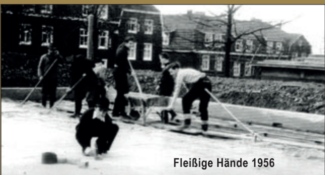
Fleißige Hände 1956

Den unermühtlichen Aufforderungen von Vereinsvorsitzendem Alfred Henckels an die Stadt Wuppertal, eine vereinseigene Rollschuhbahn zu bauen, kam man dann 1955 nach und sogleich wurde mit der Arbeit am Gelände Am Hofe begonnen. In vielen Stunden Eigenleistung entstand dann 1956 die neue Spielfläche. Auf Fulgeritplatten, die auf Balkenlagen geschraubt wurden, konnte man nun vortrefflich laufen, wenn auch schon öfter mal die eine oder andere Schraube sich löste.