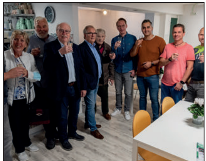
Mit einem Glas Sekt wurden die treuen Sponsoren des RSC herzlich im neu renovierten Vereinsheim begrüßt

funden. Bei kühlen Getränken und Snacks, die von unseren RSC-Damen vorzüglich erstellt wurden, konnte man sich bei zwanglosen Gesprächen näher kommen und das anschließend stattfindende Derby RSC gegen Remscheid live miterleben. (pk)