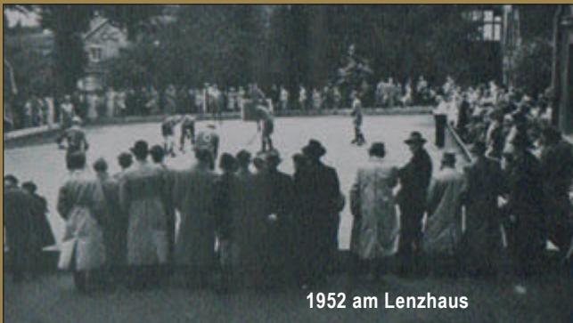
1952 am Lenzhaus