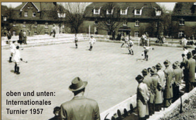
oben und unten: Internationales Turnier 1957

Den unermühtlichen Aufforderungen von Vereinsvorsitzendem Alfred Henckels an die Stadt Wuppertal, eine vereinseigene Rollschuhbahn zu bauen, kam man dann 1955 nach und sogleich wurde mit der Arbeit am Gelände Am Hofe begonnen. In vielen Stunden Eigenleistung entstand dann 1956 die neue Spielfläche. Auf Fulgeritplatten, die auf Balkenlagen geschraubt wurden, konnte man nun vortrefflich laufen, wenn auch schon öfter mal die eine oder andere Schraube sich löste.