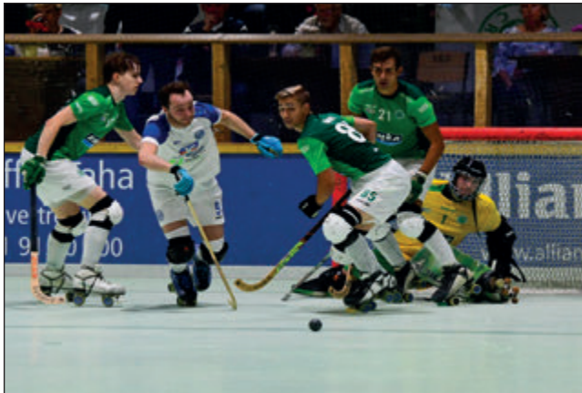
Die Löwen ersetzen durch Kampfkraft die körperliche Überlegenheit der Gäste aus Remscheid

Begegnung eine echte Werbung für den Sport. Niemand war nach dem Spiel enttäuscht, denn die Löwen hatten eine kämpferisch starke Leistung mit begeisterten Zuschauern im Rücken gezeigt. Das Match war bis zur vorletzten Minute offen war, da der RSC bis auf 3:4 herangekommen war.