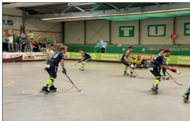
Konzentriert wenig Raum ließen die Löwen den Düsseldorfer Angreifern