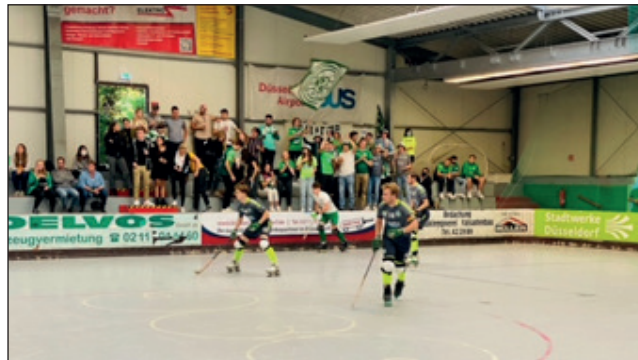
Zahlreiche Löwen-Fans unterstützten ihre Mannschaft lautstark

Unter der Anfeuerung vieler RSC-Fans traten die RSC-Löwen in der Düsseldorfer Rollsporthalle an. Mit einem deutlichen 4:1 untermauerte das