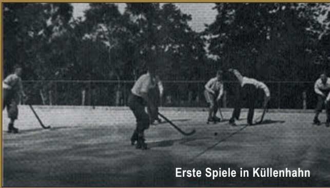
Erste Spiele in Küllenhahn

Ja, so begann es mit Cronenberger Rollsport im Jahr 1932 als Unterabteilung der Cronenberger TG.