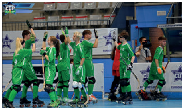
Das RSC-Team konnte beim Eurockey-Cup wertvolle Erfahrungen sammeln

den ersten Cronenberger Turniertreffer feiern.