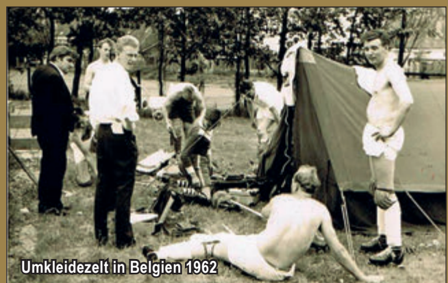
Umkleidezelt in Belgien 1962